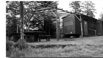
Cabane des Chasseurs

Nature, convivialité, repas champêtre, terroir et balade au coeur de la forêt vosgienne.