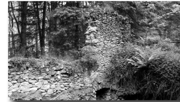
Ancienne Ferme du Bouxerand

Départ et arrivée à Fraize – lieu-dit La Séboue